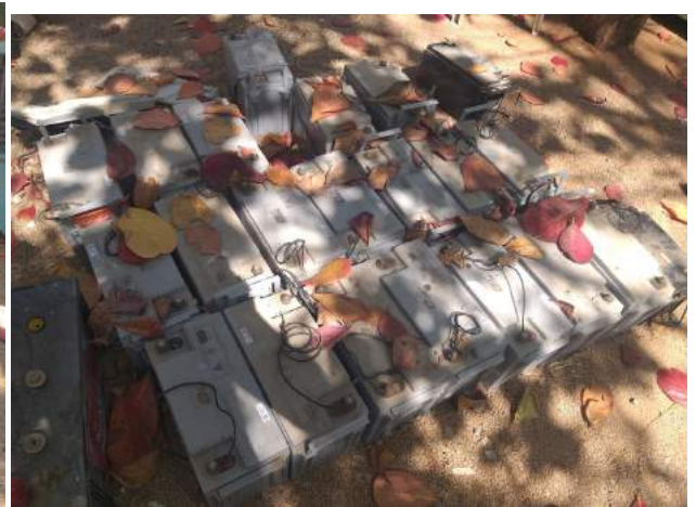
Identified unused E waste material