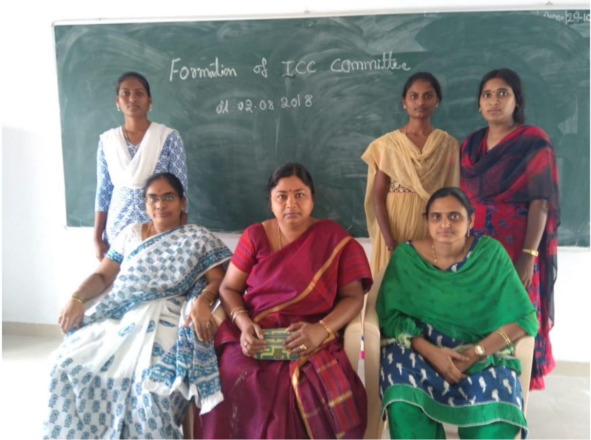
ICC MEETING DT. 17.7.18