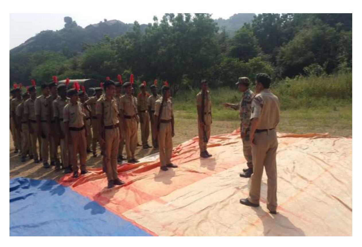
NCC cadet's participation in training programmes in 2016-17