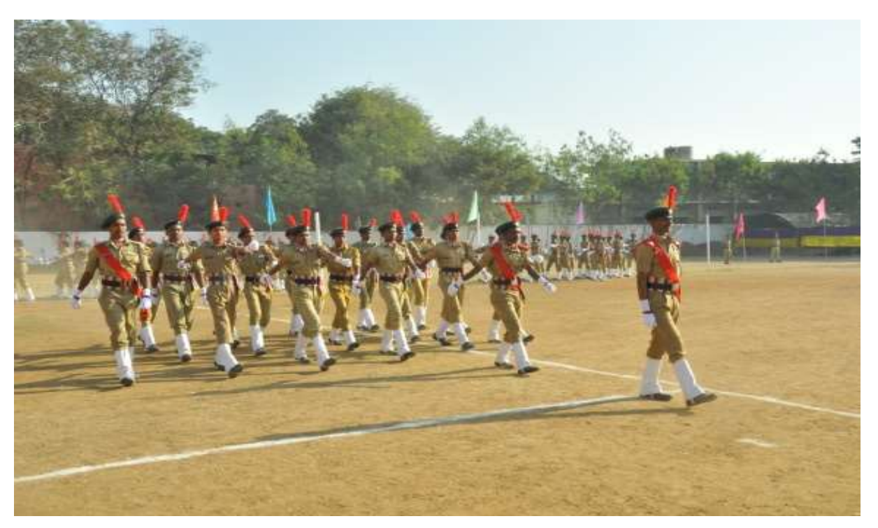
NCC cadets parade on Republic Day 2017