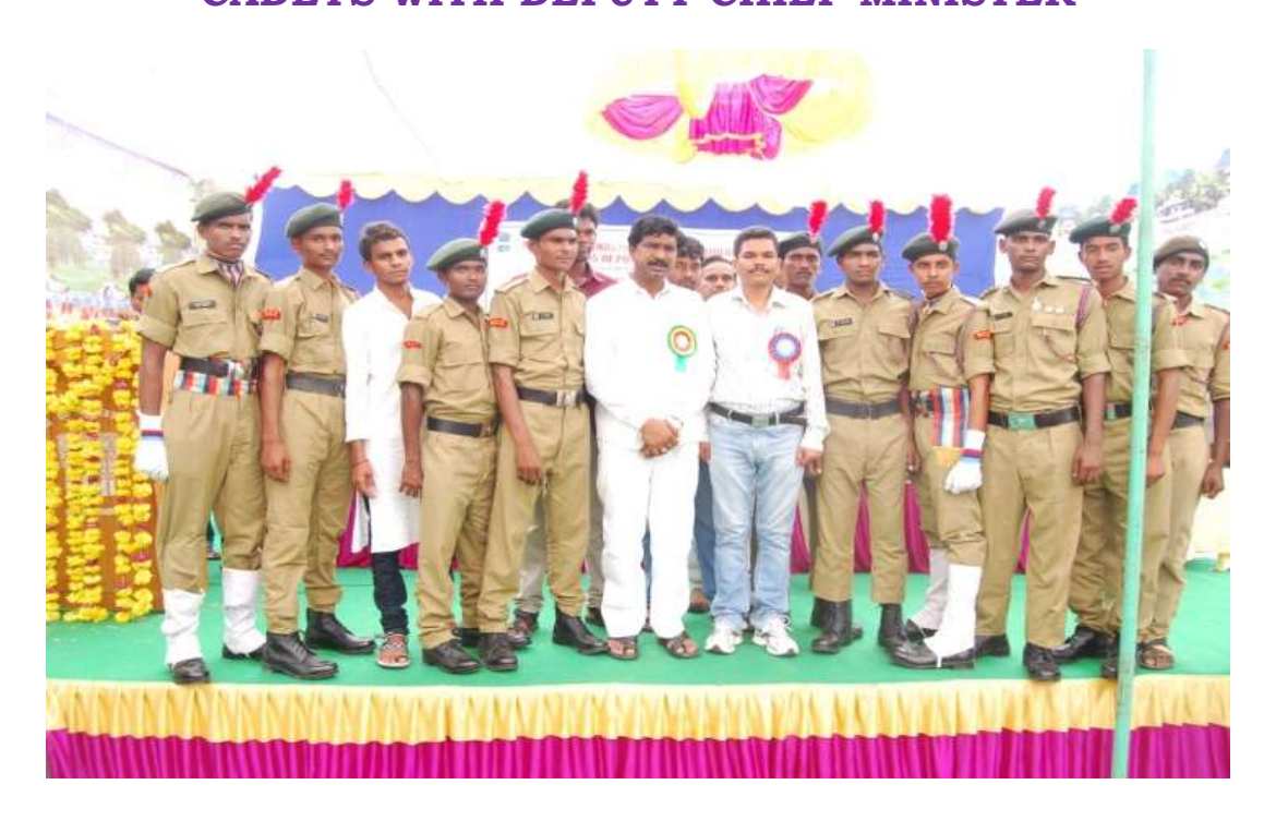
2016-17 CADETS WITH DEPUTY CHIEF MINISTER