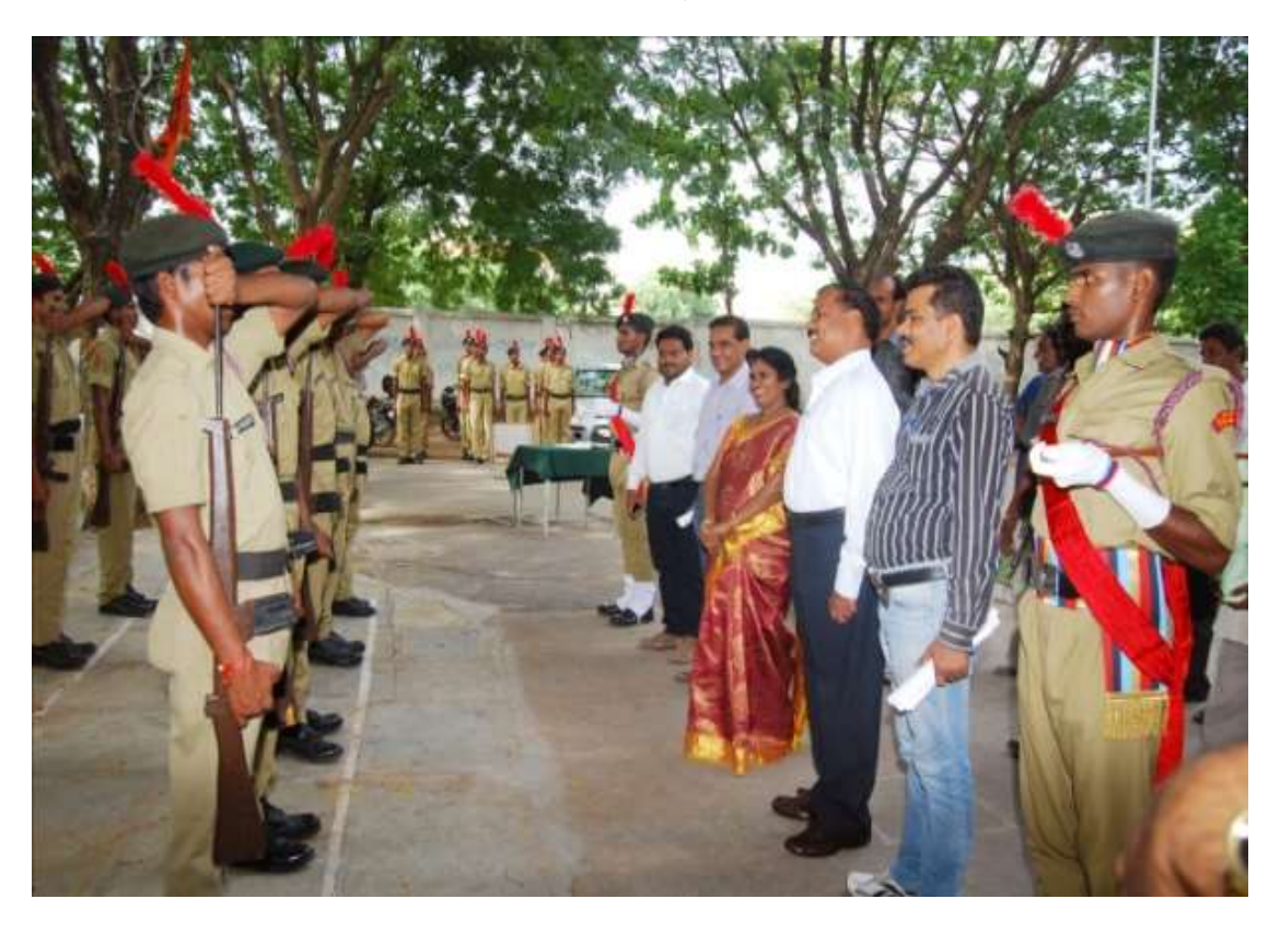
Guard of Honour by Cadets