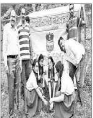
S්රායාවේ රාංඡවා ම්බුන්, පකැරු කිරුකර්ගන්ව වෙන්රීරුව් මූවික මරණවේ බාසුන මෙන්නු මාර්ගව ම්ර්ඩාන