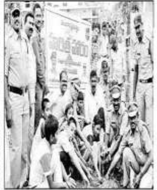
ධාජුවා නංඩාඡාත්, సీపీఎస్ పోలీసుల