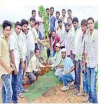
పాలకవారం ప్రారంభ కార్యక్రమంలో భాగంగా శుక్రవారం మడేకొండ శివారు రాంపూర్ రోడ్లో మొక్కలు నాటుకున్న వైద్య ఆరోగ్యశాఖ అధికారులు, వ్యవసాయ శాఖ అధికారులు, జాగృతి నాయకులు

ವಿವೃಕ್ಕೌಂಡ,ಅಂಬ್ಲಡಕ್ಕ್ 8: ನಗರಂಪ್ పరుని పందుగ మొదలైంది. శుక్రవారం నగరంలోని అన్ని ప్రాంతాల్లో హరిత నందడి నెలకోనడం కనిపించింది. ఊరూవాడ ఒక్క కైంది.ఉద్యమకారుల్ల ముందుకు కనిలి మొక్కలు నాటారు. ఎవరి వేశుల్లో చూసినా పర్షన్ మిక్షన్ దర్శన మీరాయి. పిల్లణ, పెద్దరు. పుద్దులు అన్నదేమిటీ అన్ని చయ time and Busial's light about కరణనం కనిపించింది. వనరంలోని నజు కడలరు కనిపించింది. నగరంలోని పలు ద్రమత: కారా-లయాలు, ప్రవతం, స్థైవేటు నివీర శాఖ అధిశారులు కూరా మొక్కలు పాఠశాలలు, దేవాలయాలు, ప్రార్థనా మందరాలు, పాళీ స్టరాల్లో పెద్ద సంజ్మలో Bother white thholes హారితహారం కార్యక్రమార్కి విజయవంతం దేయాంనే దీక్ల అందరిలో గోచరించింది.