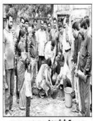
බාජුවා නත්වණුන්, යීඨම් බ්බේසර් පවුණ

රාතුම්මත් එම්මල් (ආණුතනත්), ක්ලේක්ෂ්රේ ස්ම సాయంత్రం వరకు మొక్కల నాటారు. పుటీకారి. ఒక్కరు మొక్కలు నాటి. పర్యావరవాన్ని పరిక్షకులాయి. නවා අතුර කිරුව කළුනු කළීම් කරුව තුරුව ලිදු දිනුව (සිරුව) නතුව වේ කු ఆర్వర్యంలో హెడ్కానిస్టేజున్ల రని శ్రీవర్ కానిస్టేజున్ల కైర్ కెశ్రీవర్ ఇన్ఫాడ్ గనివారం హహ్మకాండలోని గడేష్ట్ గర్ యాదవపగర్ పీడ్తార్ల స్కూర్ తదితర ప్రాంతాలలో බැතුප අපර ර බරල්ලා කිරීම විප වුණි మాట్లడుతూ రాష్ట్రా హరిశవస్వరా మార్చేయకు రాష్ట్ర ప్రకుత్వం ప్రతిష్టాత్వకంగా చేపట్లిన రెండో విడత హరితహా వ్యాద కార్యకమంలో మీఎస్ ఎప్పై సమస్ ఏఎస్పై సంజీ వరంగల్లికెం, మ్యాప్ట్ మ్యాపరణం పరిరక్షింవేం వరెడ్డి నోడల్ ఆఫీసర్ వీరస్వామి శ్రీమీవాసరావు రవి