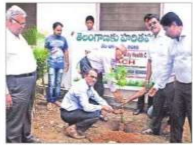
మొక్కలు నాటుతున్న పాస్టర్లు, సంఘం సభ్యులు

కేయూక్యాంపస్: కాకతీయ యూనివర్సిటీలో జాతీయ