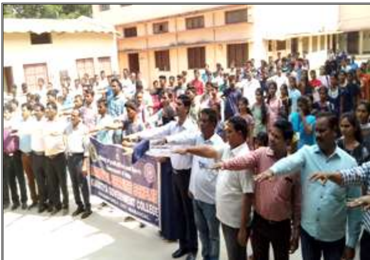
National Voters Day Pledge on 25 th of January, 2020