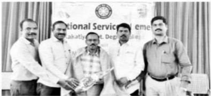
ప్రిన్సిపాల్ను సన్మానిస్తున్న ఎన్ఎస్ఎస్ ప్రోగ్రాం అధికారులు