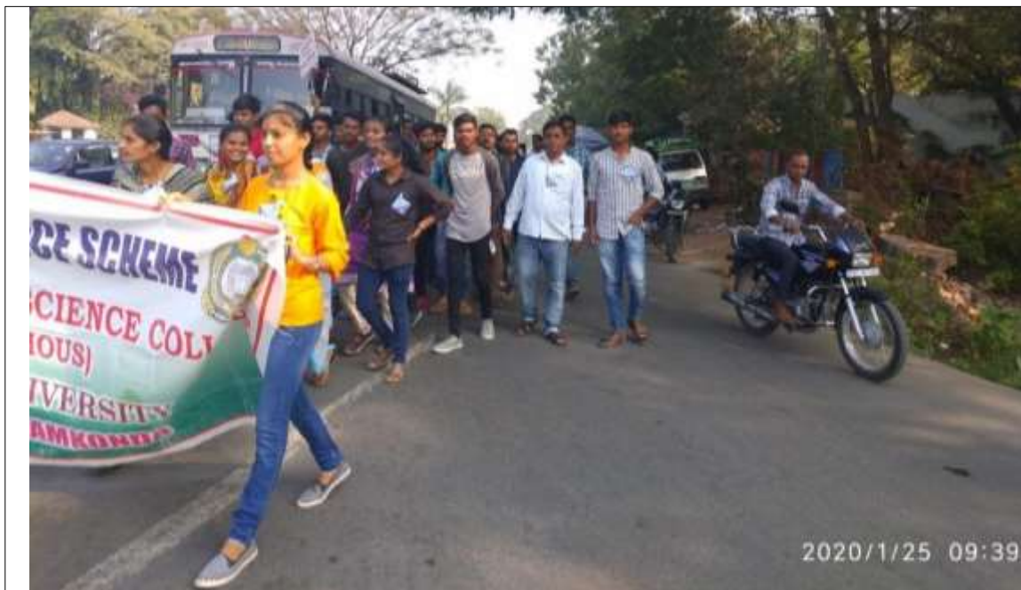
Volunteers Participated in National Voters Day rally from KU to Ambbdkar Bhavan