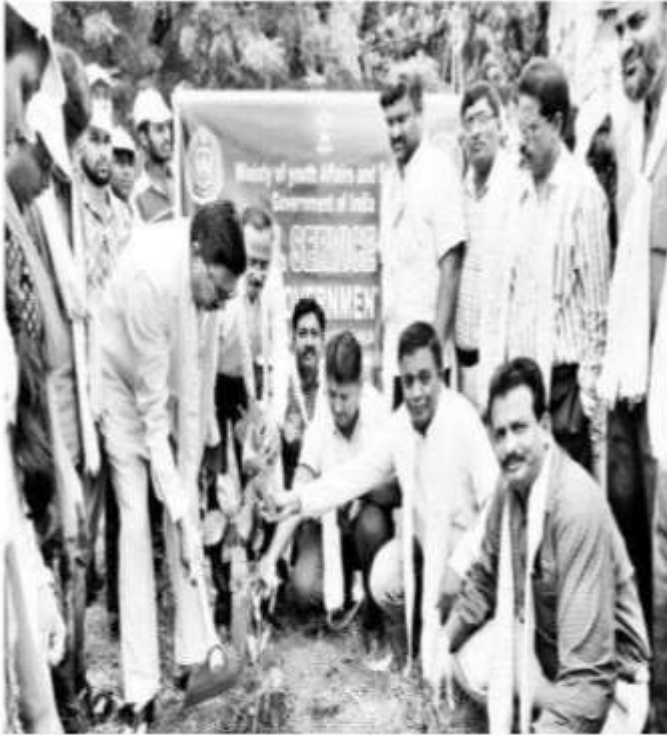
మొక్క నాటుతున్న కుడా చైర్మన్ మరియు యాదవరెడ్డి