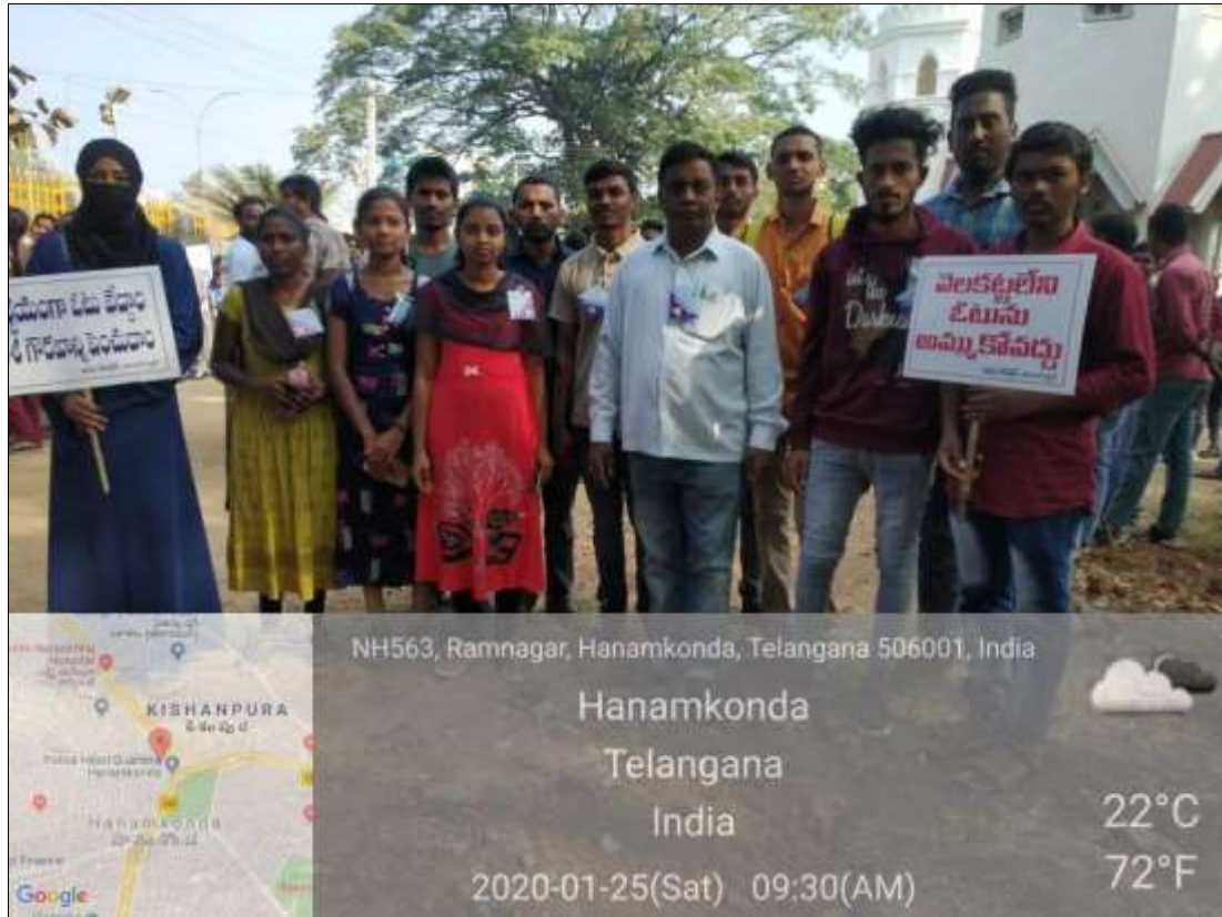
Volunteers Participated in National Voters Day rally from KU to Ambbdkar Bhavan