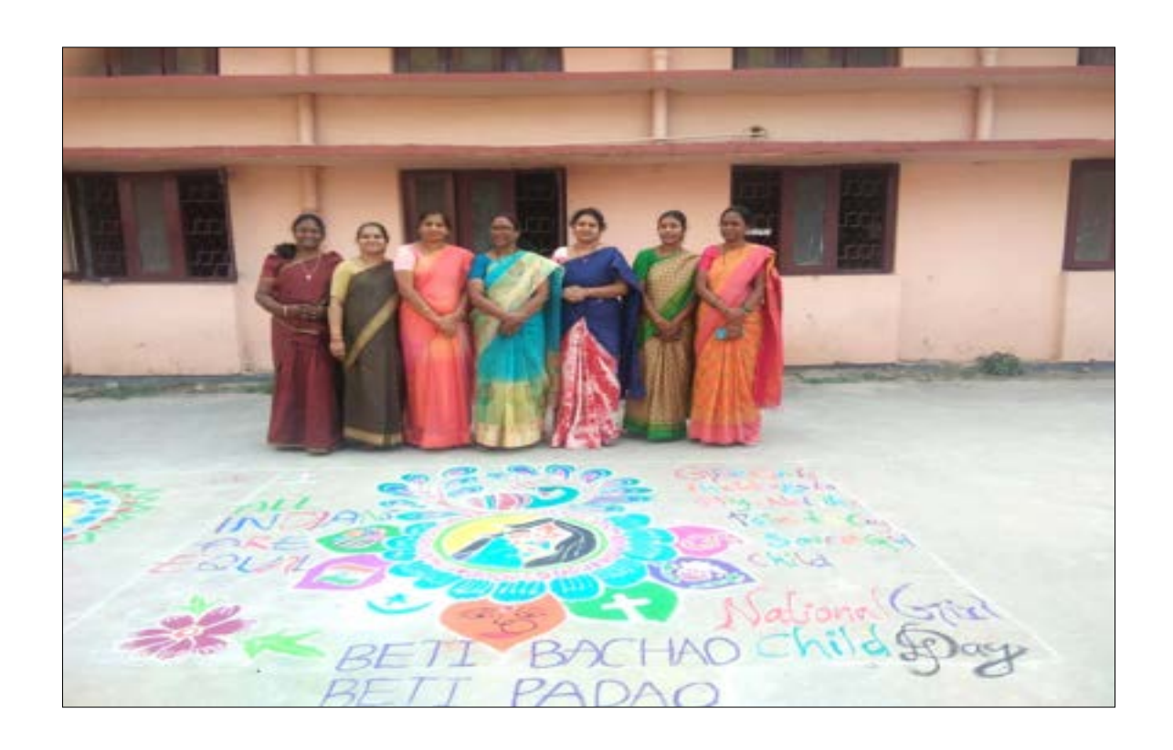
Student's Rangoli on "Beti Bachao and Beti Padao"