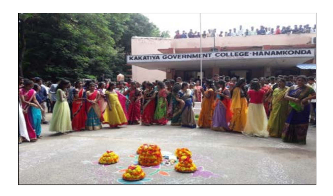
The girl students roaming around the Batukammas by singing songs