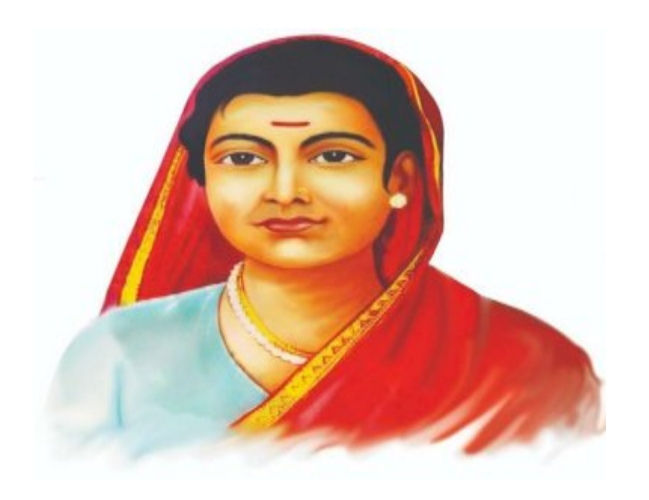
Smt. Savithri bai Phule - Pioneer of Women Education

Hence Women empowerment Cell creates a platform for women and encourages them to participate actively in curricular and co curricular activities along with other gender sensitization programmes specially designed for them.